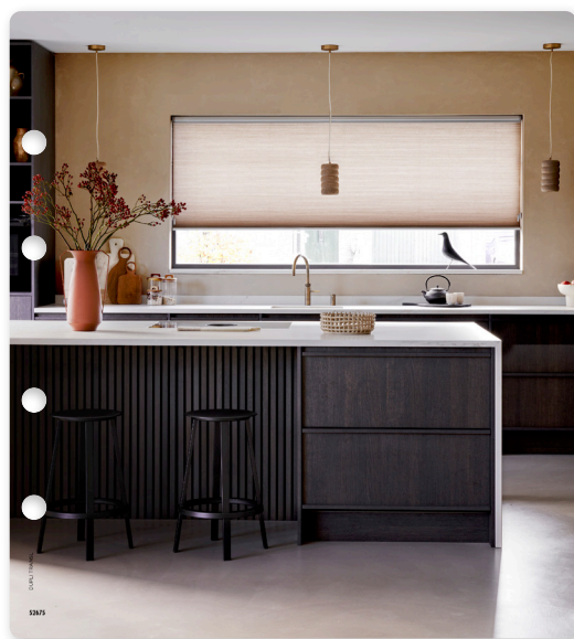
Page de garde stores dupli translucides

Découvrez et téléchargez les plus récentes photos et vidéos d'intérieur sur becedealer.com