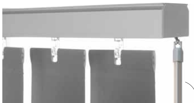
Tige de levage et d'orientation