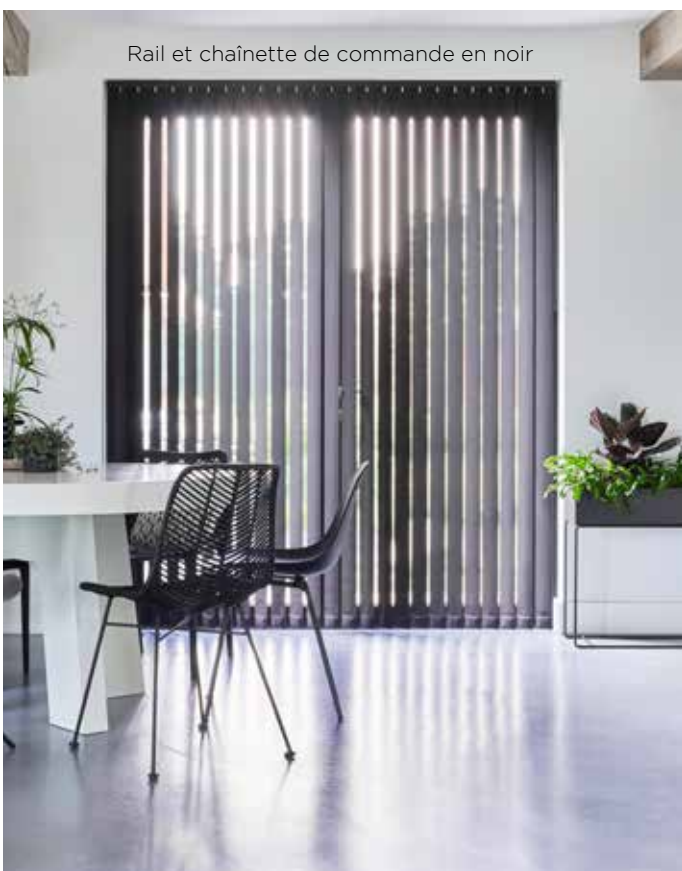
Rail et chaînette de commande en noir

Vous pouvez télécharger les plus récentes photos de la collection sur dealer.bece.com/images . Sympa à utiliser sur votre site web ou sur vos réseaux sociaux !